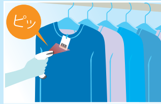
POS / 入出庫検品