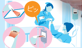
受付管理 / 3点照合 / 薬局での棚卸