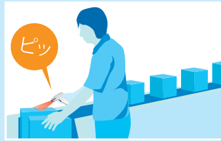
工程管理 / トレース管理 / 部品、治具管理