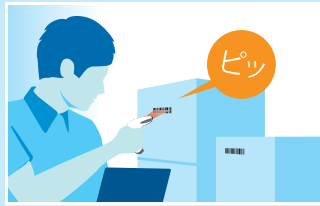
入出荷検品 / 梱包検品