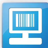
液晶読み取り 対応