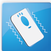
バイブレーション 機能