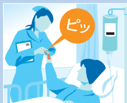
3点照合 / 薬局での棚卸 / 訪問看護