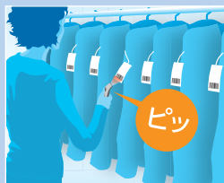
POS端末/ ルートセールス端末