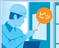
保守・巡回確認端末