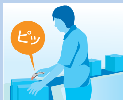
入出荷実績収集 / ピッキング (WMS端末)