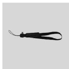
ハンドストラップ