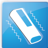
バイブレーション機能