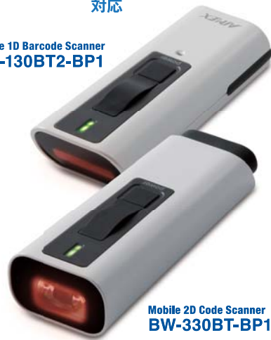
Mobile 2D Code Scanner BW-330BT-BP1