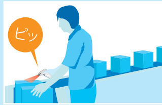
工程管理 / トレース管理 / 部品、治具管理